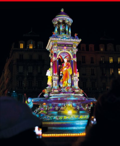
Illuminationen anlässlich „Fêtes des Lumières“ in Lyon